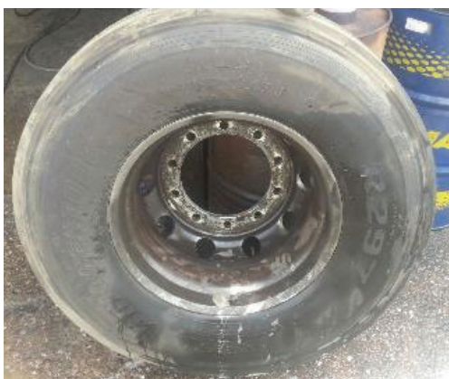
Avant le nettoyage