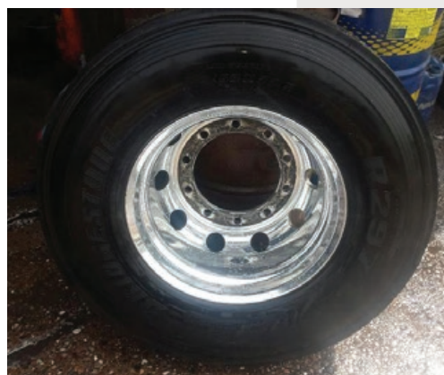
Après le nettoyage